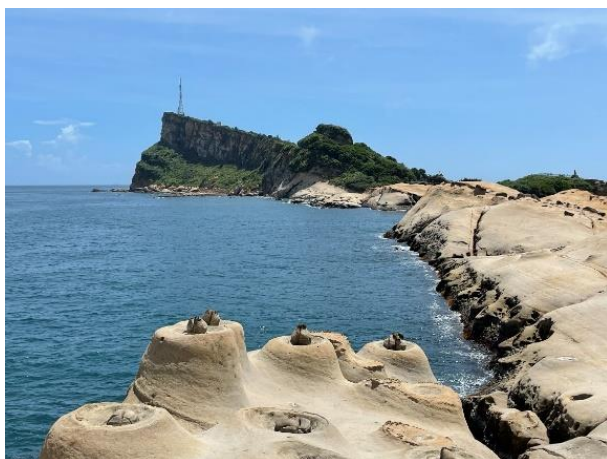
圖 1 台灣地景保育網任選一張地景的照片或自行拍攝或選用照片(請務必註明出處)